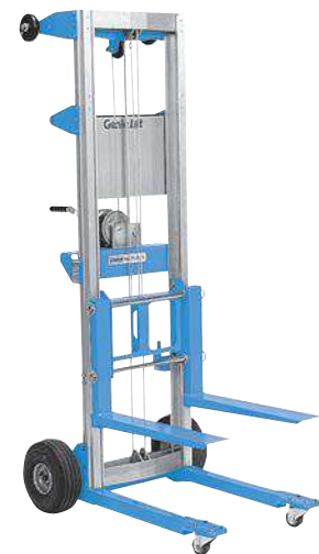
(1) Solo en recambios